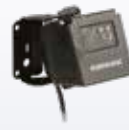
90ACC0170 CSS; Çok Yönlü Montaj özelliğiyle